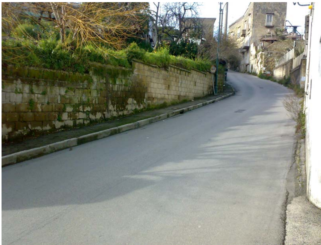
Via Camaldolilli, i muri di contenimento