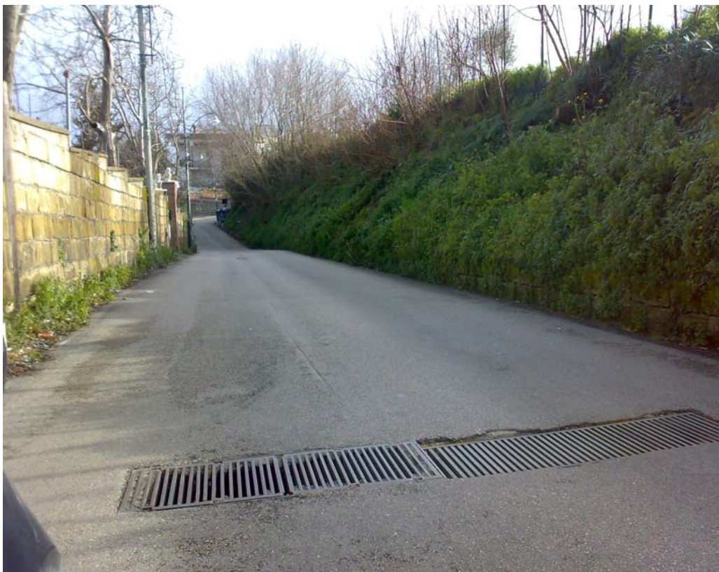
Via Camaldolilli, le griglie di raccolta dell'acqua